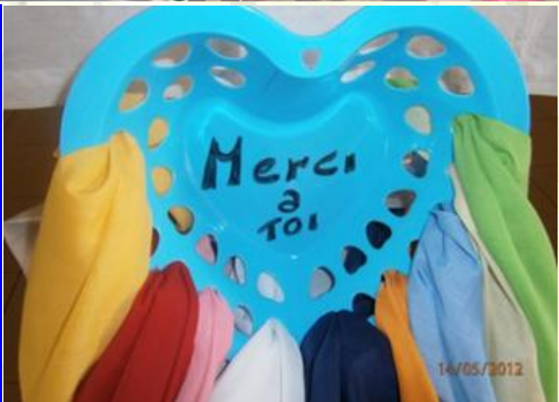
Fête de Marie Dominique Mazzarello - Yaoundé