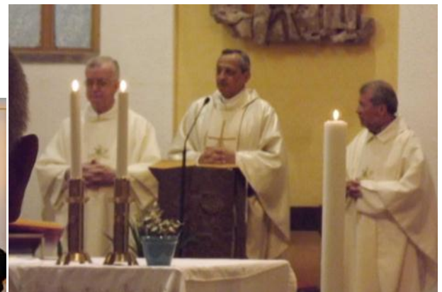
Messe présidée par le Recteur Majeur