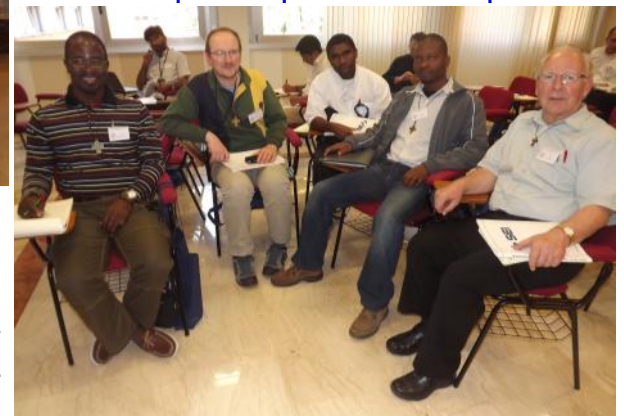
Travail en groupe